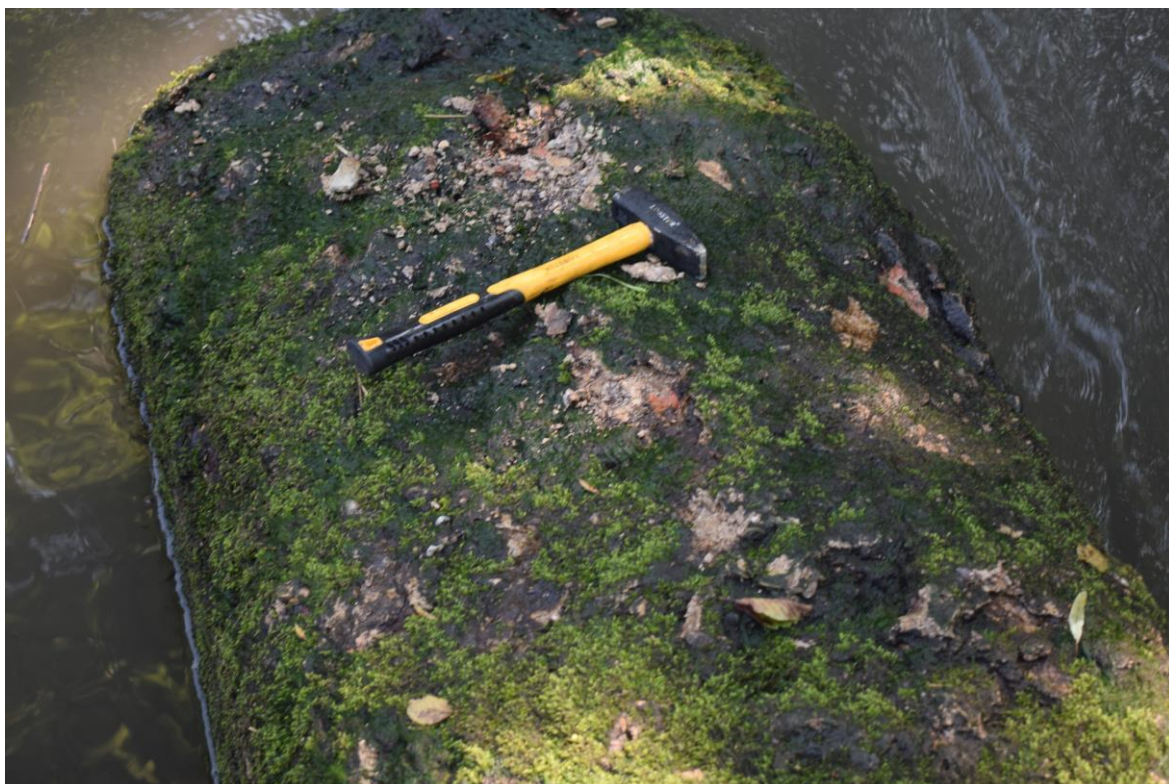
degradovaná dělicí zeď jezových polí