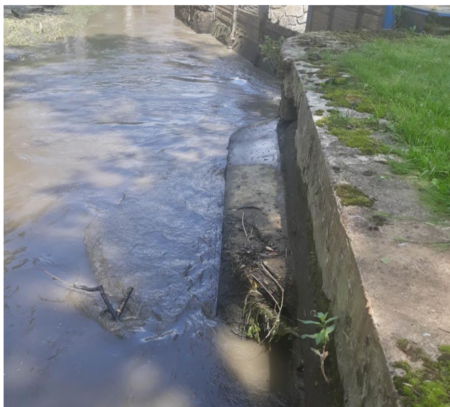
pravobřežní opěrná zeď (pohled po vodě)