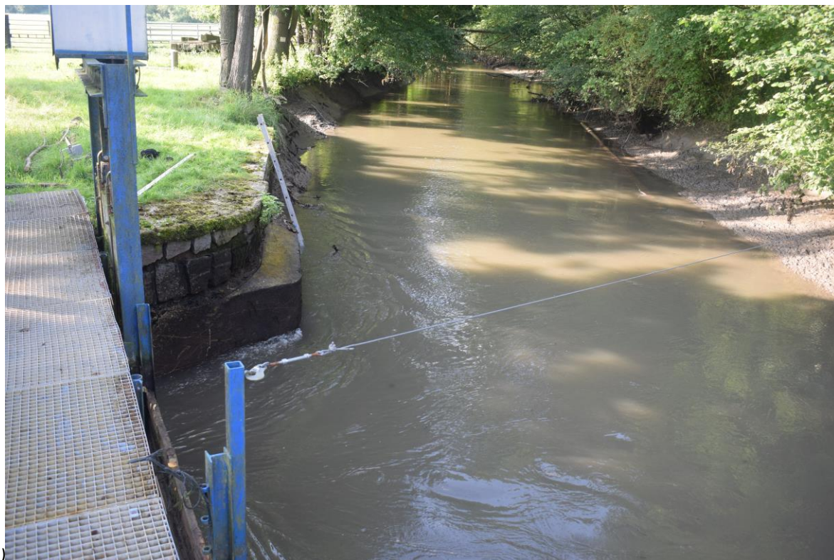
pravobřežní opěrná zeď nad jezem (pohled proti vodě)