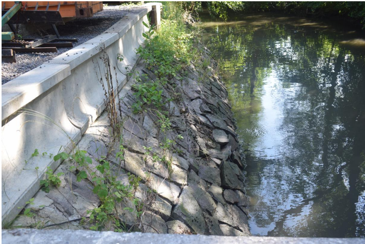
kamenná rovnanina za vývarem (doklínování)