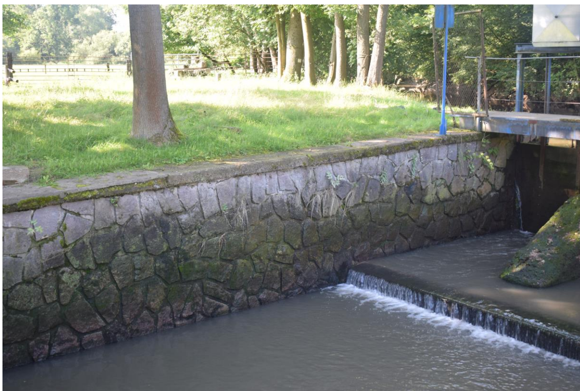
levobřežní opěrná zeď pod jezem (spárování)