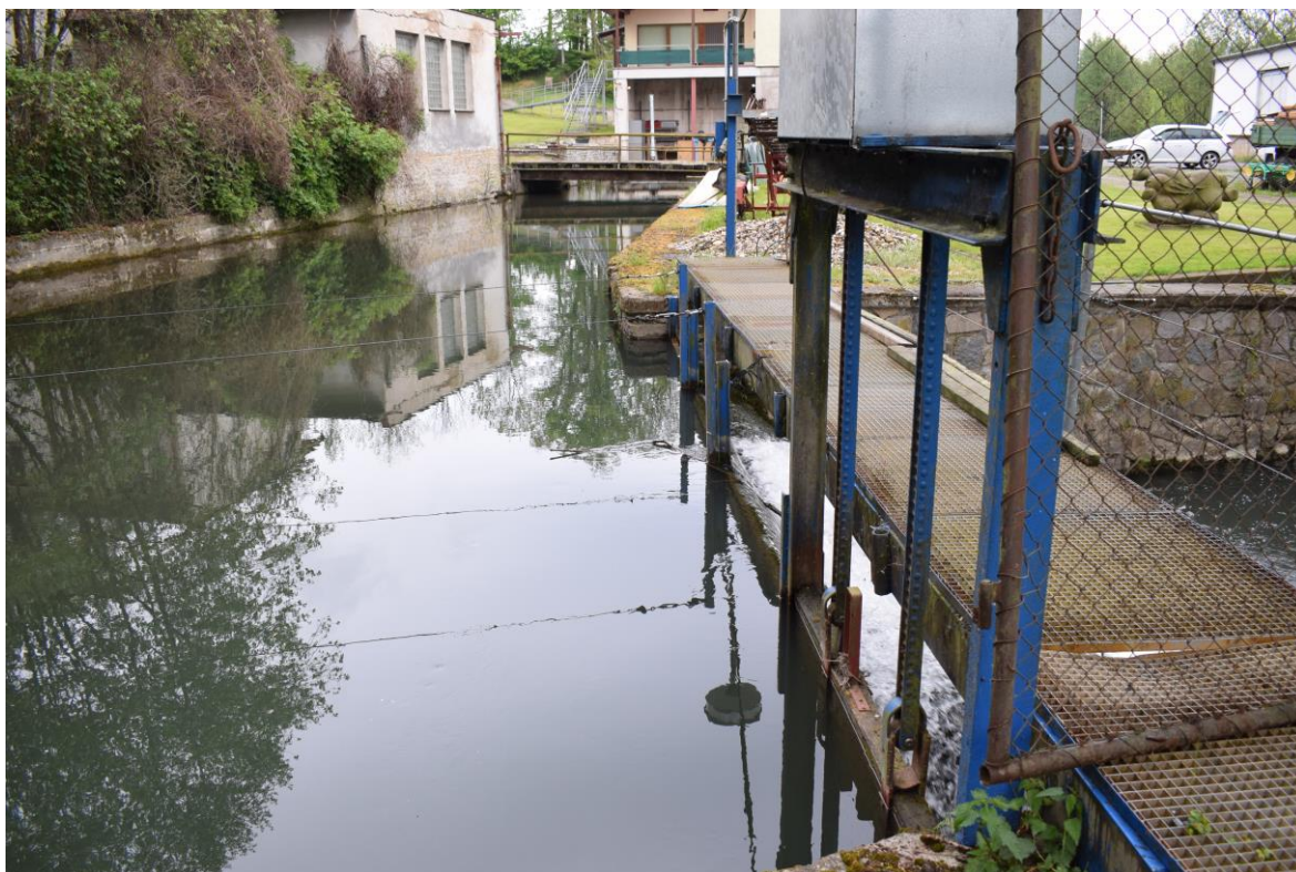
manipulační lávka, ocelové konstrukce, stavidlo, náplanky (pohled po vodě)