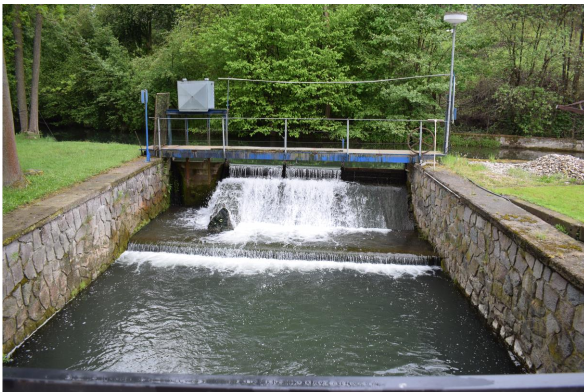
Jez Vysoké Mýto – Čápvna (pohled proti vodě)