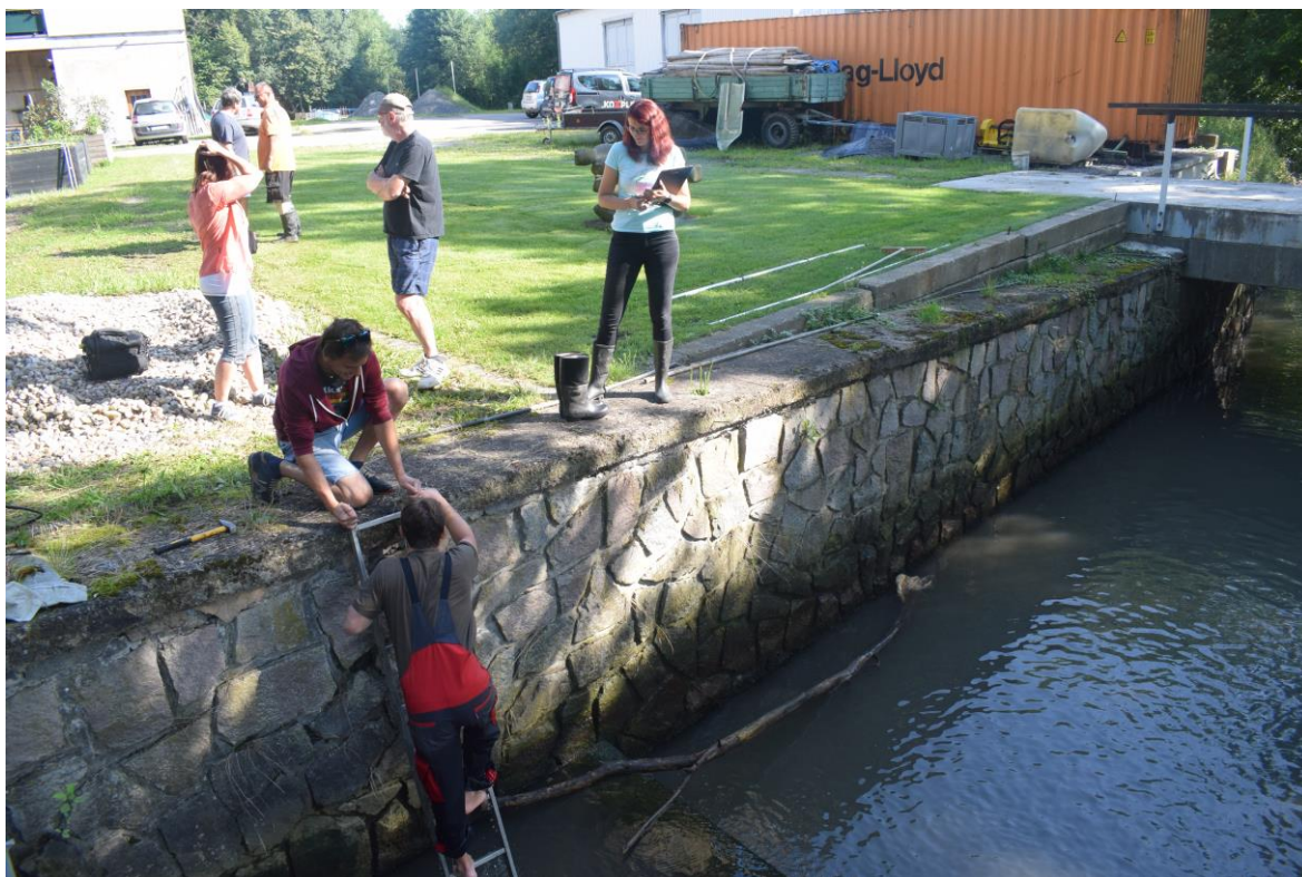
pravobřežní opěrná zeď pod jezem (spárování)