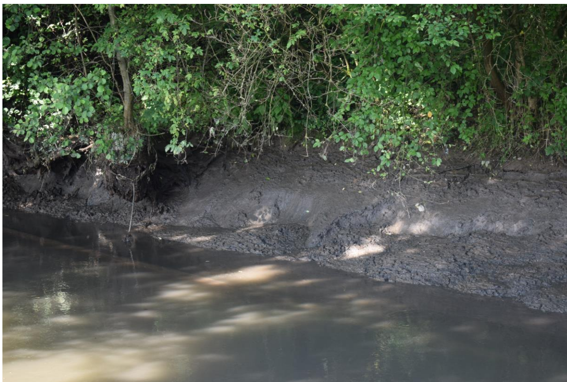
sediment v korytě vodního toku k odtěžení