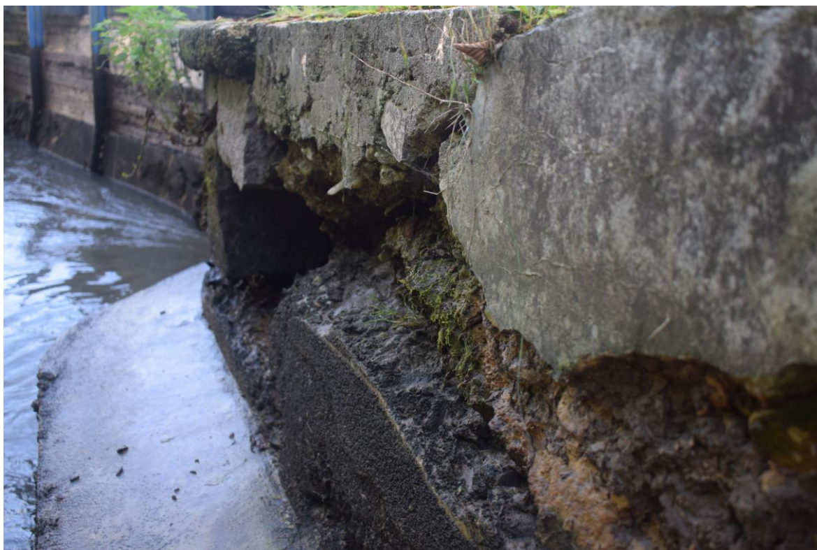
degradace pravobřežní opěrné zdi nad jezem