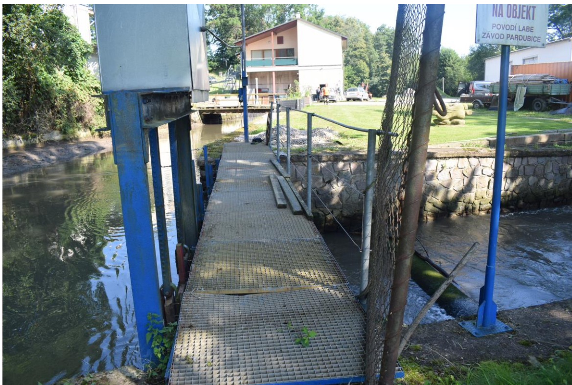
manipulační lávka, ocelové konstrukce, stavidlo, ocelové rošty