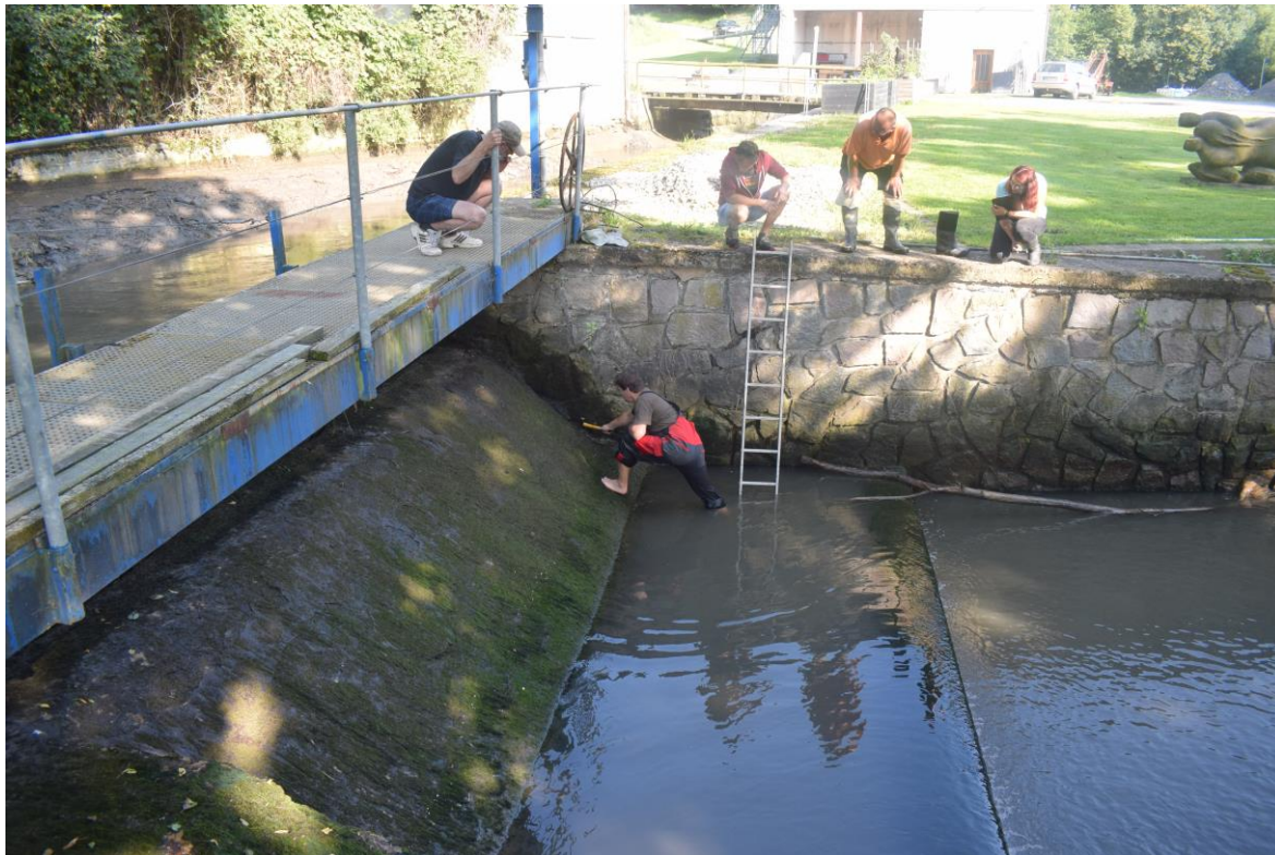
přelivná plocha jezu